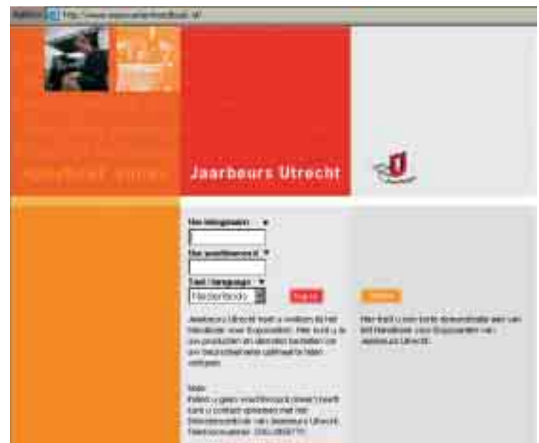
Zo'n 70 procent van de exposanten van Infosecurity heeft voor de voorbereiding van de beurs gebruik gemaakt van het handboek online.

Het internethandboek vervangt de papieren versie die het komend jaar nog zal bestaan naast de digitale versie. Organisatoren kunnen het elektronische handboek linken aan de website van een beurs of evenement. Braaksma: 'Daarmee wordt de beursite een internetportaal waarmee de gehele beursdeelname geregeld kan worden. Makkelijker kan het voor exposanten niet.'