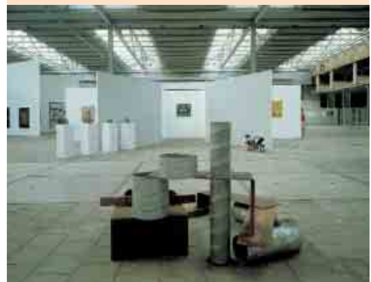
Kunstenaars-salon terug in Jaarbeurs.