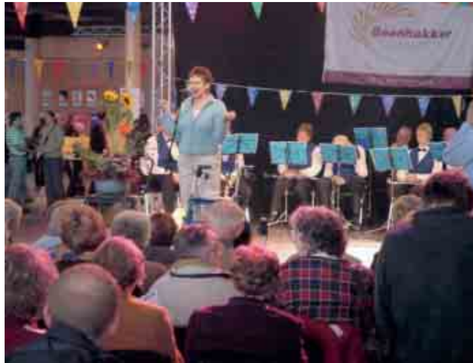
Jaarbeurs Utrecht is het hele jaar door het podium voor zeer diverse activiteiten. Vorige maand was voor de eerste keer de uitkomst, een manifestatie voor jong en oud met de rollator in de hoofdrol.

Voor de eerste keer nemen ook coffeeshops aan de hennepbeurs deel. 'Verder zijn er stands met voorlichting over gezondheidszorg, spreken deskundigen over actuele onderwerpen en adviseert een advocaat geïnteresseerden over de